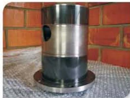
Luva de desgaste com revestimento oxi-cerâmico nos colos de vedação