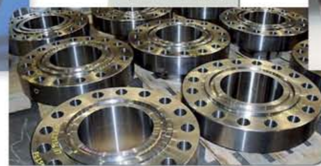
Flanges fabricadas em Inconel® 625