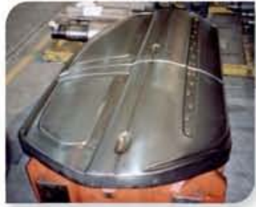
Moide cromado para repuxo de chapas revestidas com zinco