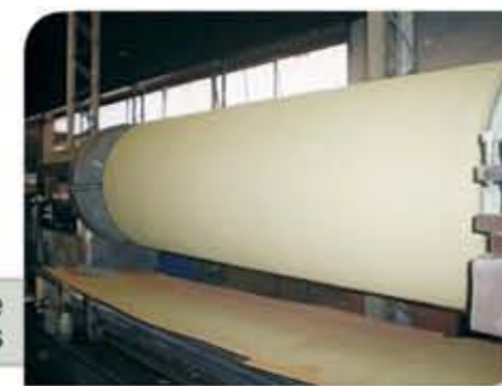
Sink Roll da linha de galvanização de bobinas