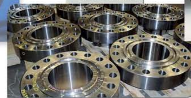
Flanges fabricadas em Inconel® 625