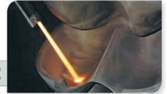
Rotor de Turbina Pelton revestido com Carbeto de Tungstênio