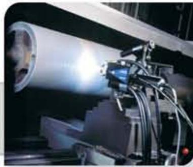
Cilindro de máquina de papel com a mesa revestida por aspersão térmica a arco elétrico