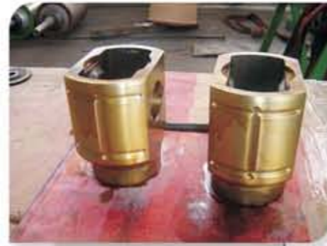
Cruzetas de compressor revestidas com metal patente