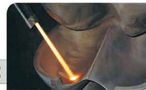
Rotor de Turbina Pelton revestido com Carbeto de Tungstênio