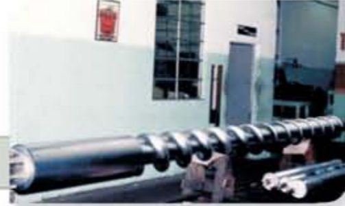
Rosca de extrusora de plástico cromada