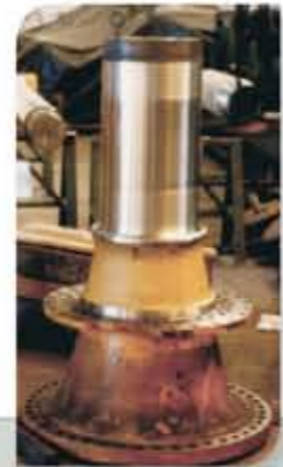
Ponta de eixo de caminhão fora de estrada com os colos de mancais recuperados por aspersão térmica a arco elétrico