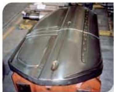
Moide cromado para repuxo de chapas revestidas com zinco