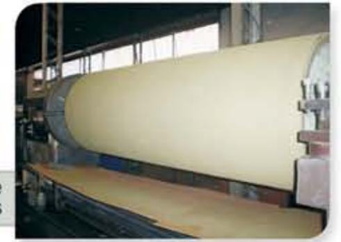
Sink Roll da linha de galvanização de bobinas