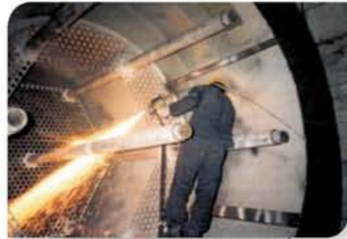
Trocador de calor revestido com alumínio