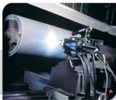
Cilindro de máquina de papel com a mesa revestida por aspersão térmica a arco elétrico