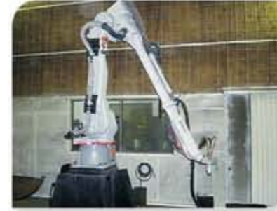
Robô de 6 eixos para revestimento de peças seriadas e de alta precisão dimensional