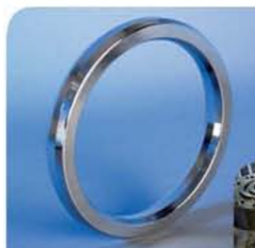
Anel de vedação metal / metal tipo BX fabricado em Monel® 400