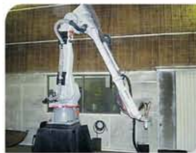
Robô de 6 eixos para revestimento de peças seriadas e de alta precisão dimensional