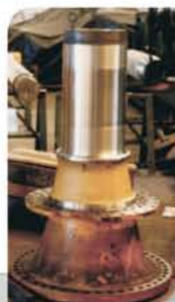
Ponta de eixo de caminhão fora de estrada com os colos de mancais recuperados por aspersão térmica a arco elétrico