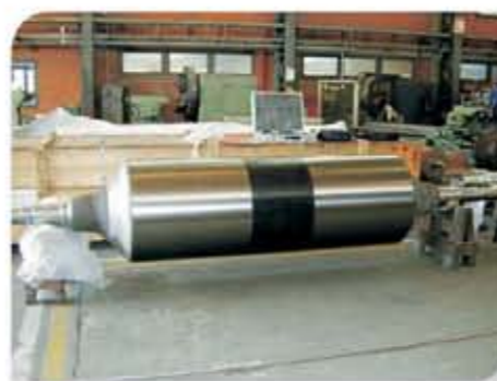
Rolo de forno de recozimento da linha de galvanização de bobinas