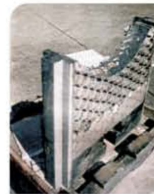
Guias Laterais de Válvula Gaveta revestidas com Stellite® pelo Processo PTA e com Carbeto de Cromo, Processo Hipersônico