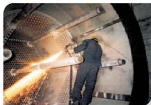
Trocador de calor revestido com alumínio