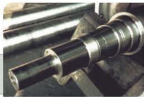
Colos de mancal de cilindro laminador revestidos com material oxi-cerâmico