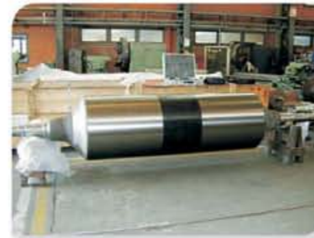
Rolo de forno de recozimento da linha de galvanização de bobinas