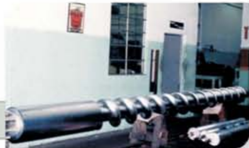
Rosca de extrusora de plástico cromada