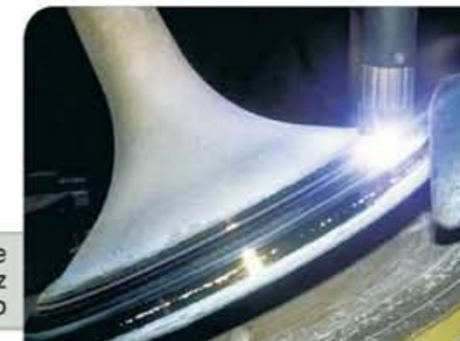
Pista de assento e vedação de haste de válvula, revestida com liga matriz cobalto com Processo Hipersônico