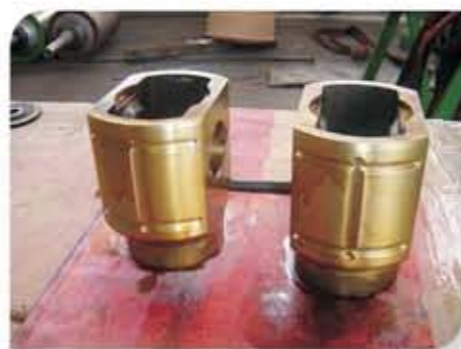
Cruzetas de compressor revestidas com metal patente