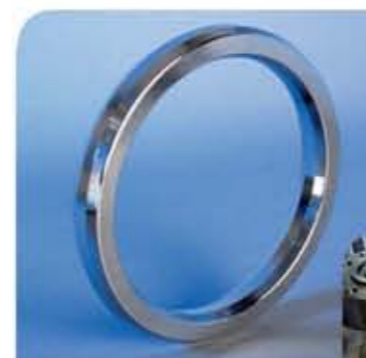
Anel de vedação metal / metal tipo BX fabricado em Monel® 400