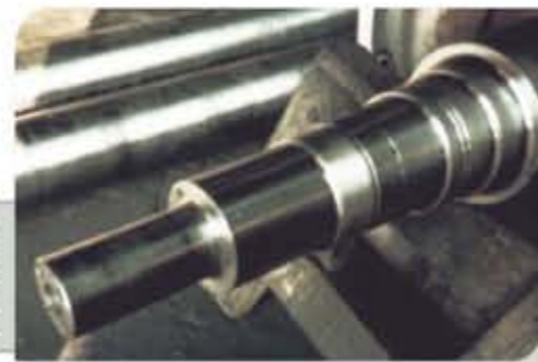
Colos de mancal de cilindro laminador revestidos com material oxi-cerâmico