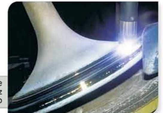
Pista de assento e vedação de haste de válvula, revestida com liga matriz cobalto com Processo Hipersônico