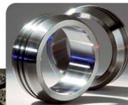
Buchas de desgaste fabricadas em aço Superduplex