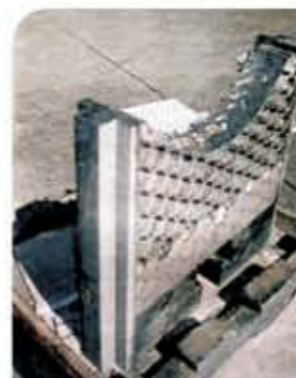
Guias Laterais de Válvula Gaveta revestidas com Stellite® pelo Processo PTA e com Carbeto de Cromo, Processo Hipersônico